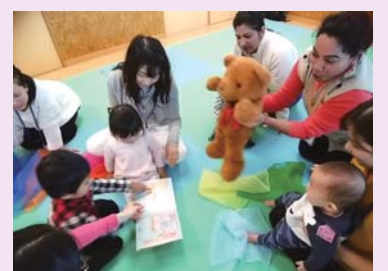
英語の手遊びや母国語での自己紹介など

📍 西区地域子育て支援拠点スマイル・ポート ☎ 264-4355 fax 264-4350